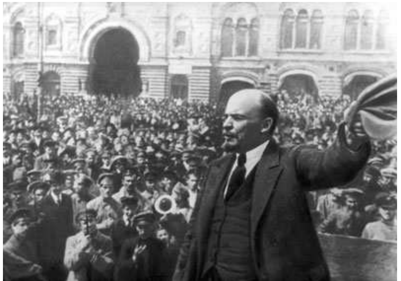
Vladimir Ilitch Lenine, líder da Revolução Russa, dirige-se às massas

Para continuarmos a analogia, imaginem que, nesta situação, muitas “autoridades” intelectuais, juntamente com outras pessoas que lhes seguem os passos, apanhavam o comboio e diziam coisas como: “não só foi ingenuidade como foi mesmo criminoso