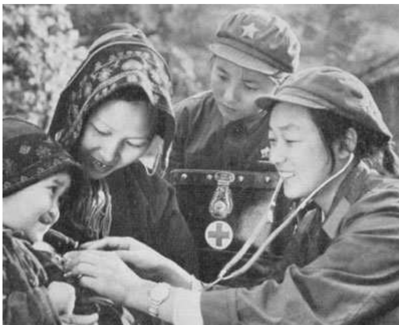
Uma foto oficial do início da década de 1970, de promoção do movimento dos médicos pés-descalços

Sejamos claros, a Revolução Cultural foi uma verdadeira revolução. Perturbou a rotina da vida normal; foi cheia de invenção e inovação; inspirou dezenas de milhões de pessoas mas também chocou e perturbou dezenas de milhões logo desde o seu início. As escolas fecharam; os jovens foram para os campos para se ligarem aos camponeses, os estudantes de Pequim foram a Xangai fomentar protestos nas fábricas, os operários foram encorajados a erguer a cabeça e perguntar: “Quem realmente manda aqui?” Isto tornou-se muito desordenado. Havia um debate político e intelectual generalizado: reuniões nas ruas, protestos, greves, manifestações, aquilo que ficou conhecido como os “cartazes de grandes caracteres” que continham comentários e críticas às políticas e aos líderes. O papel e a tinta eram fornecidos gratuitamente, os edifícios públicos eram disponibilizados para reuniões e debates. 20