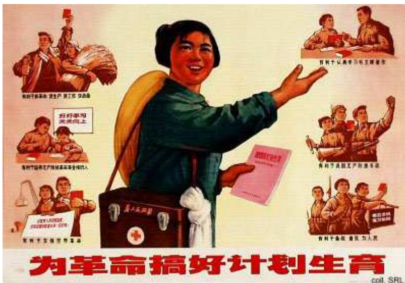
Cartaz de divulgação do movimento dos médicos pés-descalços

Como é que isto pôde acontecer? Por um lado, a Revolução Cultural teve a oposição férrea de poderosas forças neocapitalistas que ocupavam posições importantes na sociedade chinesa: no Partido Comunista, no governo e nas forças armadas. Essas forças, tal como Mao tinha salientado, faziam parte do fenómeno socio-histórico da revolução chinesa: elas eram constituídas por “democratas burgueses” que se tinham convertido em “seguidores da via capitalista”. Deixem-me explicar.