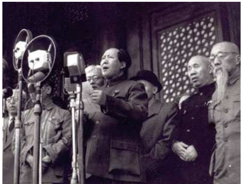
Mao Tsétung proclama a fundação da República Popular da China na Praça Tiananmen em Pequim a 1 de Outubro de 1949

Começemos pelo livro Mao: A História Desconhecida , de Jung Chang e Jon Halliday. O livro tem sido apresentado na comunicação social estabelecida como a biografia definitiva de Mao Tsétung e esteve na lista dos mais vendidos do jornal New York Times . Jung Chang e Jon Halliday querem que vocês acreditem que Mao era um hedonista cínico que assassinou dez vezes mais inocentes que Hitler. Insistem que Mao era um assassino frio – mas como não podem comprovar isso com factos, o livro está repleto de mentiras e distorções.