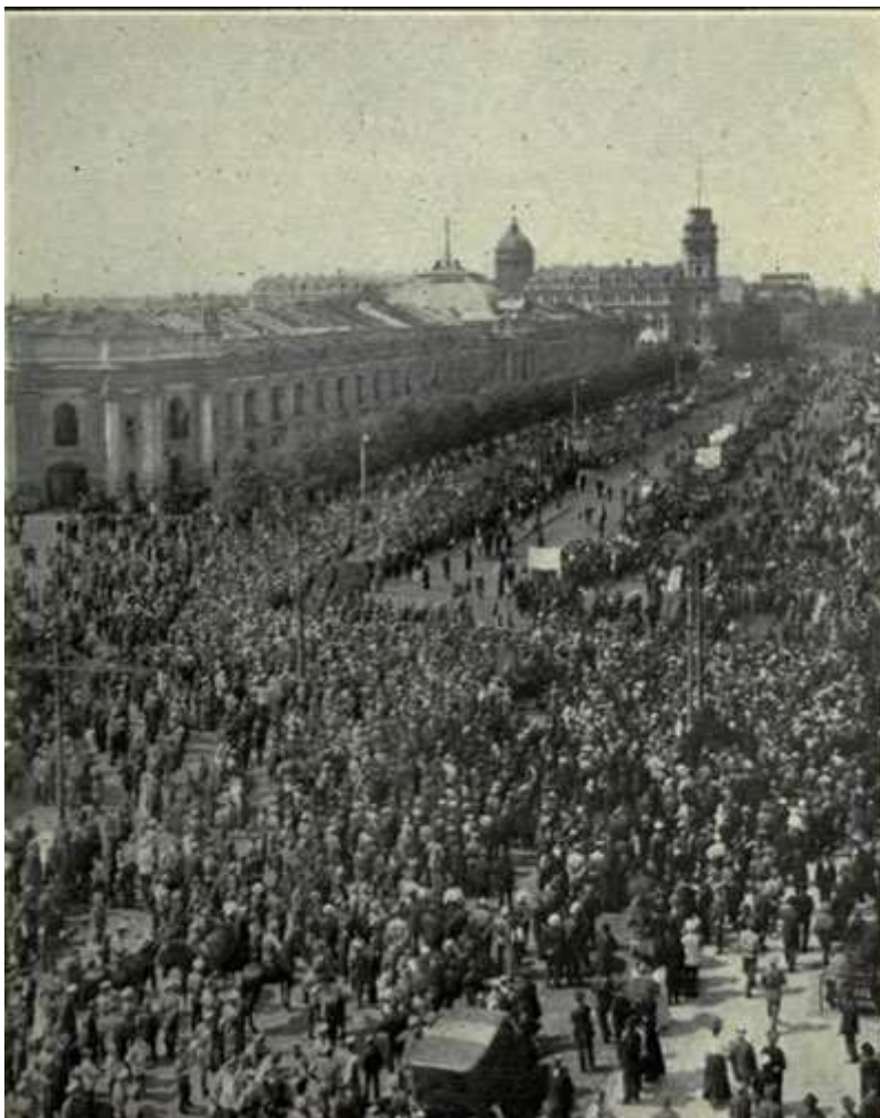
Manifestação na Nevsky Prospekt, São Petersburgo, Julho de 1917, um dos muitos levantamentos das massas que precederam a Revolução de Outubro na Rússia.

O comunismo [é] um mundo onde as pessoas trabalham e lutam para o bem comum... onde todas as pessoas contribuem para a sociedade tudo o que podem e recebem tudo o que precisam para viverem uma vida digna de seres humanos... onde deixa de haver divisões entre as pessoas em que