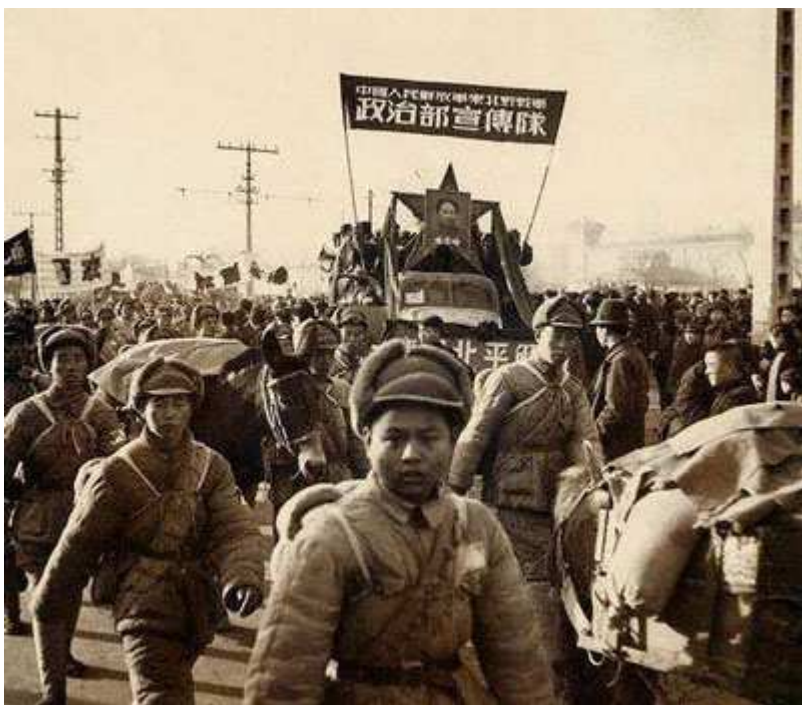
Militantes comunistas entram em Pequim durante a Revolução Cultural

MacFarquhar descreve o contexto em que Mao iniciou a Revolução Cultural. Eis como MacFarquhar o faz: “Vários comentários indicam que Mao ansiava por uma medida de terror catalítico para desencadear a Revolução Cultural. Ele não tinha nenhum escrúpulo em tomar vidas humanas. Numa conversa com pessoas leais numa fase posterior da Revolução Cultural, o Presidente chegou a sugerir que o sinal de um verdadeiro revolucionário era precisamente o seu intenso desejo de matar”. E então MacFarquhar apresenta esta alegada declaração de Mao: “Esse homem, Hitler, era ainda mais cruel. Quanto mais cruel melhor, não acham? Quanto mais pessoas se mata, mais revolucionário se é.” 9