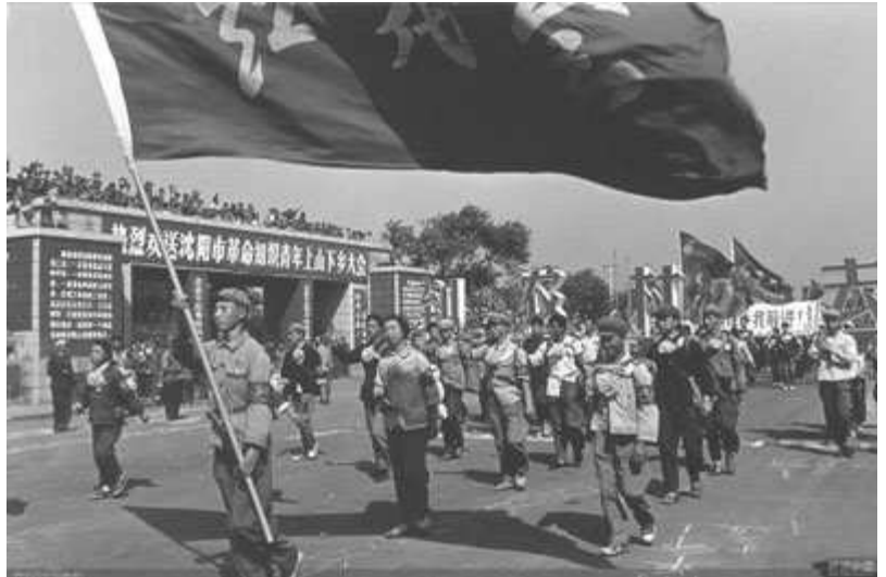
Manifestação em Shenyang em 1968 de apoio ao movimento de massas de incentivo aos estudantes e ex-Guardas Vermelhos a irem viver nos campos

Mas a “narrativa dominante” burguesa é que a Revolução Cultural foi uma purga vingativa contra os opositores de um Mao sedento de poder: uma orgia de violência sem sentido e perseguição em massa que mergulhou a China numa década de caos. Não há uma única centelha de verdade nesta narrativa. Mas antes de eu ir directamente a isso, quero enquadrar a Revolução Cultural falando um pouco sobre a sociedade chinesa antes da revolução de 1949.